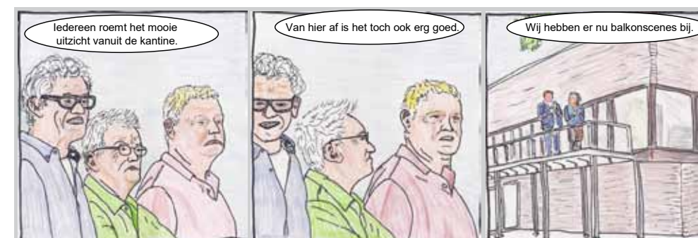
© Viltstifttekeningen, Heesch – G. E. Spot

Elke uitgave geeft striptekenaar G.E.Spot zijn visie op de actualiteit.