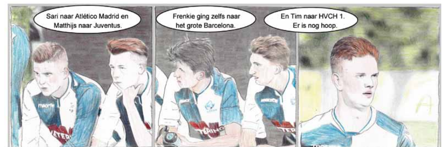
© Viltstifttekeningen, Heesch - G. E. Spot

Je kunt Armella bereiken via vertrouwenspersoon@hvch.nl of via het telefoonnummer 06-23166324.